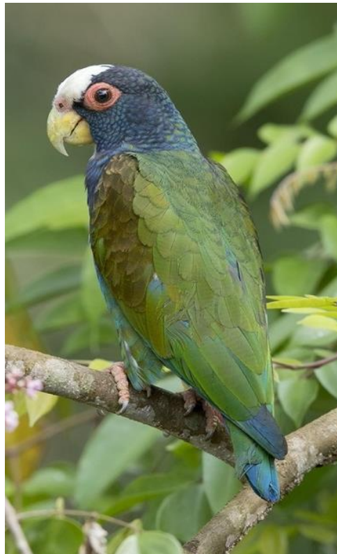
Loro corona blanco ( Pionus senilis )