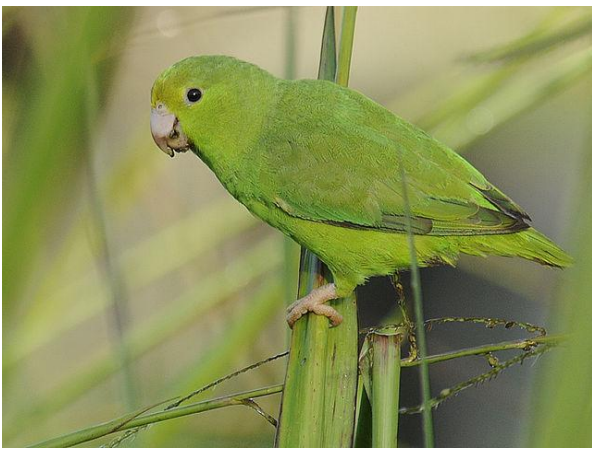
Perica rayada ( Bolborhynchus lineola )