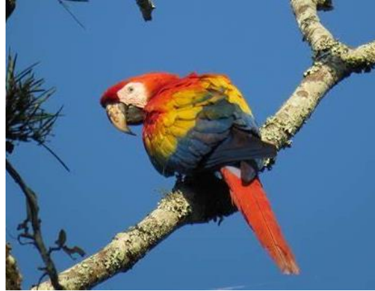
Guacamaya roja ( Ara macao cyanooptera )